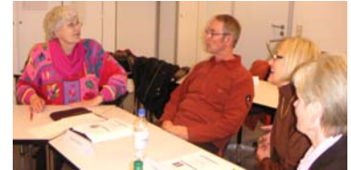
Teilnehmer bei einer Seminarübung

Seminar „Das Arztgespräch - Wie können Patienten die Kommunikation verbessern?“