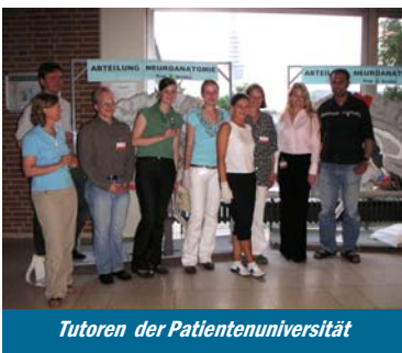
Tutoren der Patientenuniversität